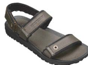
Mormaii Neocycle Papete

Na 71ª EXPO RIVA SCHUH, a Grendene reforça a imagem de seus produtos no mercado internacional em um dos mercados definidores da moda mundial - a Itália. As exportações vêm representando uma fatia importante do crescimento das vendas da Grendene que nos primeiros nove meses de 2008 apresentou um crescimento em dólar de 43,6% em relação ao mesmo período de 2007.