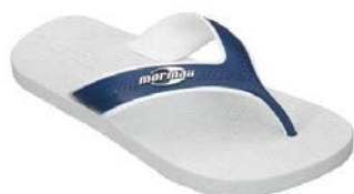
Mormaii Neocycle Tropical