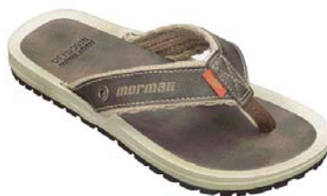
Mormaii Neocycle Dedo