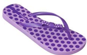
Ipanema Apliques I