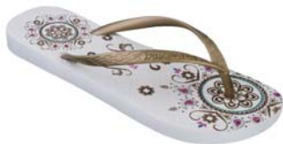
Ipanema Trends II