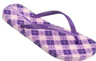
Ipanema Clássica Envolvente