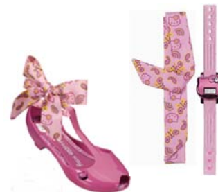
Hello Kitty Fashion Time

Para as meninas, a aposta é na gatinha charmosa Hello Kitty , que vem com tudo na coleção Fashion Time. Seguindo a tendência do uso do plástico, que já conquistou fãs pelo mundo todo, a nova sandália é versátil e pode ser combinada com vários looks. Para deixar o visual ainda mais glamuroso, a Grendene Kids presenteia as minifashionistas com um relógio personalizado com a personagem querida das pequenas.