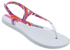
Ipanema Shine II

masculinos e de uma ampla linha kids com os principais personagens infantis. Estes fatores permitem que a Ipanema se destaque nos mercados nacional e internacional.