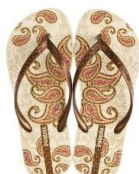
Ipanema Trends II