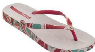
Ipanema Fashion II