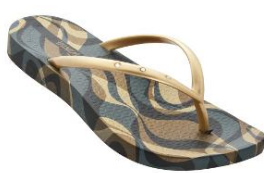
Ipanema Solar Envolvente